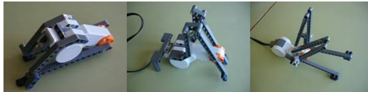
Moviment amb un sol motor

PER A TOTS ELS ALUMNES, MARES, PARES, PROFESSORS, PROFESSORES, AMIGUES I AMICS DEL CEIP BOGATELL I DE L'IES ICÀRIA