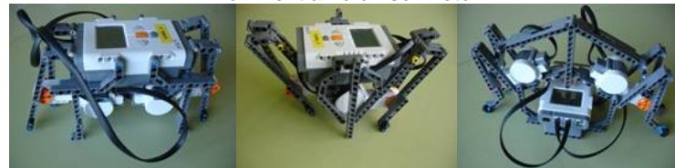
Mecanismes autònoms amb dos motors