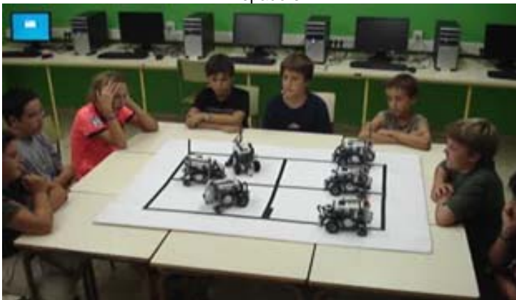
Taller de Robòtica LEGO Bogatell-Icària